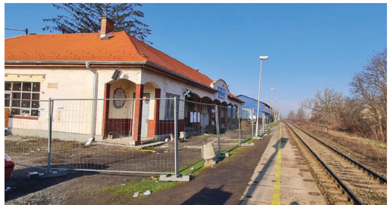
A megálló épületét a felújítás idejére elkerítették, az utasok számára nem megközelíthető.

Az Államvasutak – folytatta – nem kívánja az épület környékét is rendbe tenni, sem parkolót építeni, sem komplex módon rendezni a helyi közlekedést. „Az átépítés