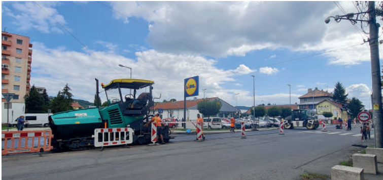
2021-ben sem maradt el az utcák aszfaltozása. Új burkolatot kaptak a Május 1., Kukučin és Mocsáry utcák, a Lidl melletti kereszteződés, a temető járdái és a halottsházhoz vezető út.