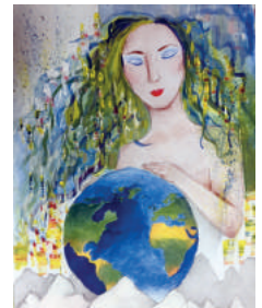
Marčeková Diana festménye.