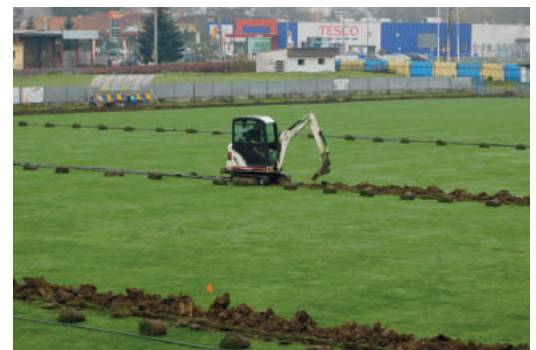
A város áprilisban beruházott a stadionba, a pálya modern digitális öntözőrendszerrel gyarapodott. Szöveg - kmk