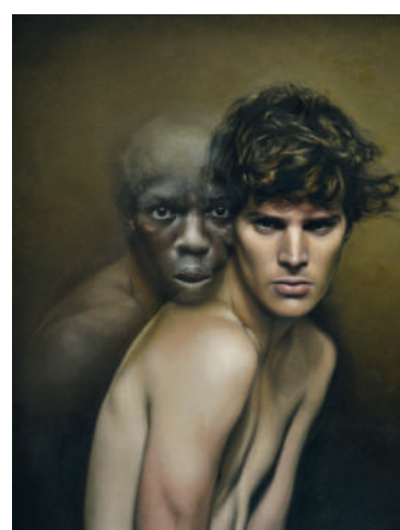
A mű címe: Lazarus.

Díjak, elismerések (válogatás): 2001 – Gazdasági Minisztérium díja, Ceredi Művésztelep díja – X. Szécsényi Őszi Tárlat, Magyarország