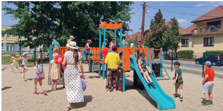
Új, modern játszótér nyitotta meg kapuit a Papréten, melyet júniusban adott át a város.