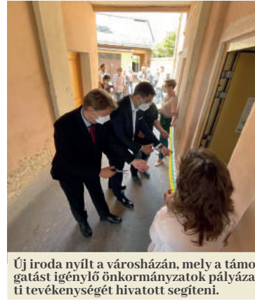
Új iroda nyílt a városházán, mely a támogatást igénylő önkormányzatok pályázati tevékenységét hivatott segíteni.