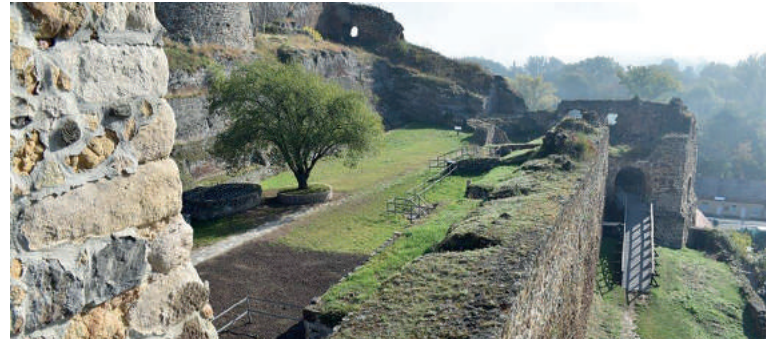
A középső várban többéves, sok mindenre kiterjedő építési és tereprendezési munka fejeződött be. A régebben megközelíthetetlen, fűvel benőtt terület ma már új látványosságokat kínál a turisták számára három felújított tüzérségi állás – kazamata – formájában.