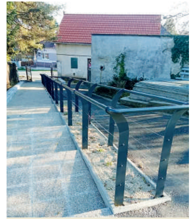
A temető széleskörű rekonstrukción esett át. A város újraaszfaltozta a régi járdákat és a bekötőutat, valamint felújította a gyalogos bejáratot.