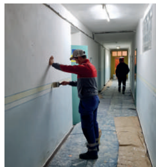
A téli hónapokban a KSZ építő csapata tovább folytatta az FTC épületének fokozatos belső felújítását.