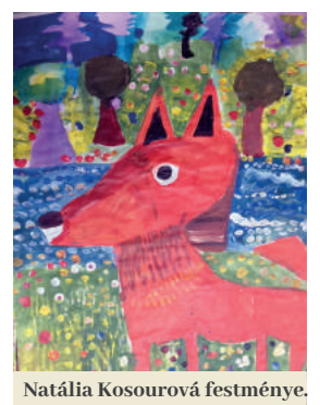
Natália Kosourová festménye.