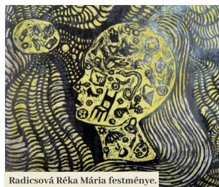
Radicsová Réka Mária festménye.