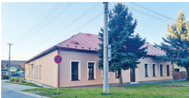
2021-ben értek véget a művészeti alapiskola egykori tereiben zajló építési munkálatok is, ahol hamarosan idősek napközi otthona kerül kialakításra. A kivitelezés során a város azt az épületrészt is felújította, amely ma a városi rendőrség székhelyeként szolgál.