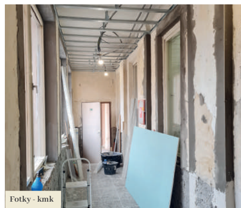
Fotky - kmk