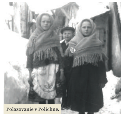
Polazovanie v Polichne.