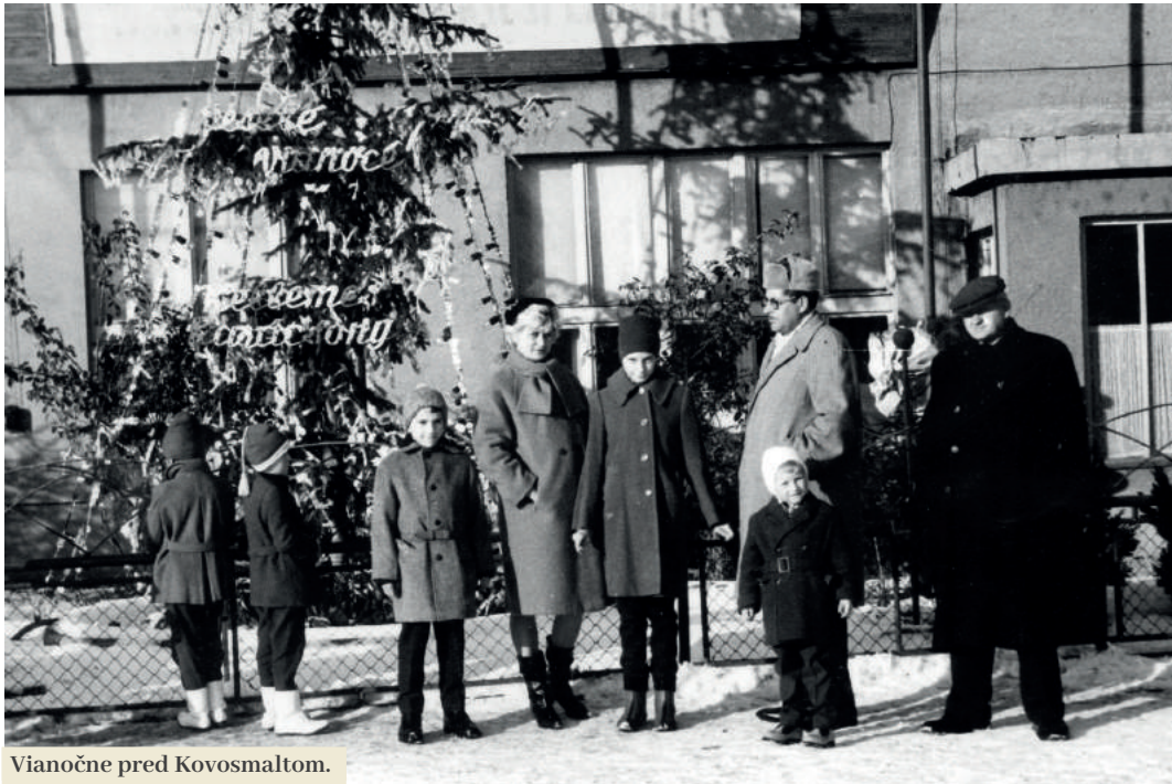
Vianočne pred Kovosmaltom.