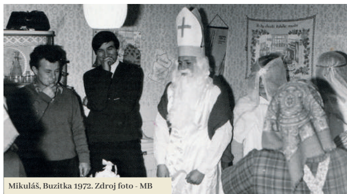
Mikuláš, Buzitka 1972.

Zvyky a obrady môžeme rozdeliť do niekoľkých oblastí. Jednou z nich sú rodinné zvyky späté s tehotenstvom, narodením, detstvom, dospievaním, dospelosťou, uzavretím manželstva či s inými udalosťami v živote človeka až po jeho smrť. Druhou skupinou zvykov sú kalendárne zvyky, ktoré sa viažu k ročným obdobiam. Zvykoslovná bohatosť sa prejavovala najmä v zimnom období. Príchod zimy znamenal príležitosť na stretávanie sa susedov, príbuzných a rovesníkov pri prácach sezónneho charakteru, akými boli oprava a zhotovovanie náradia, pradenie, tkanie, šitie, páranie peria a iné. Niekoľko opisov ta-