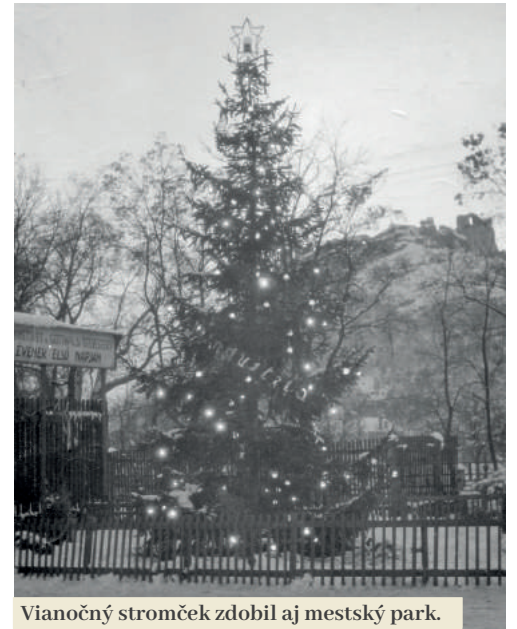
Vianočný stromček zdobí aj mestský park.