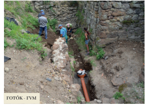
FOTÓK - FVM

a szorítón keresztül az alsó udvarra vezeti, biztonságos távolságba a várfaltól. A Múzeum ezért pályázatot nyújtott be a Besztercebányai Megyei Önkormányzathoz, amely a kulturális örökség (nemzeti kulturális emlékek és helyi nevezetességek) felújításának és rekonstrukciójának támogatására elkülönített pénzcsoportból 8000 euró összegű támogatást hagyott jóvá a füleki vár vízvezető rendszerének létrehozására. Az intézmény mintegy 2500 eurónyi társfinanszírozással valósította meg a pályázatot. A csatornázással kapcsolatos földmunkák, valamint a rá következő, az ágyúállásokon végzett állagmegóvási munkák és azok látogathatóvá tétele helyi munkanélküliek alkalmazásával valósultak meg Fülek Város két pályázata – a Szlovák Köztársaság Kulturális Minisztériumának 1.4 – Újítsuk fel házunkat elnevezésű program, valamint