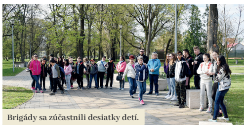
Brigády sa zúčastnili desiatky detí.