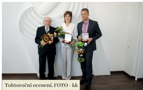
Tohtoročné ocenení.