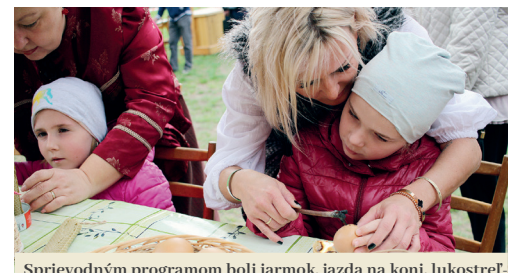
Sprievodným programom boli jarmok, jazda na koni, lukostreľba, remeselnícke dielne, maľovanie na tvár, dobový kolotoč, rozprávkový kútik či ochutnávka tradičných palóckych jedál.