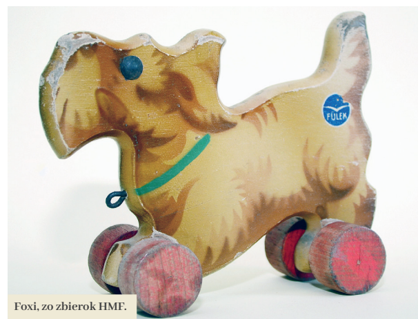
Foxi, zo zbierok HMF.