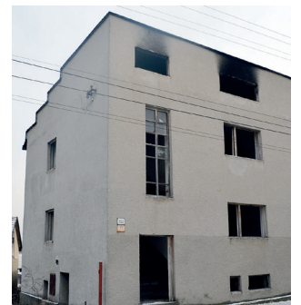
Gubányiho dom po požiari.

Mesto odpredá tzv. Gubányiho dom na Ulici Československej armády. Problematiku nehnuteľnosť odkúpila od vlastníkov, po niekoľko-ročných peripetiách, za 15 500 eur. Vedenie mesta k tomuto