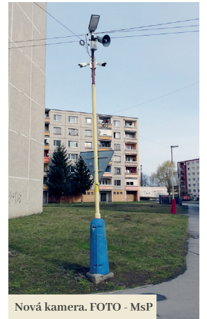
Nová kamera.

Samospráva Filakova začiatkom tohto roka úspešne zrealizovala projekt z výzvy Ministerstva vnútra SR na prevenciu kriminality pre rok 2018. Vďaka nej sa v meste podarilo umiestniť 10 nových statických kamier a zakúpiť nové nahrávacie zariadenie spolu s monitorom. Na projekt ministerstvo poskytlo finančnú dotáciu vo výške 6000 eur, s 20-percentnou spoluúčasťou mesta.