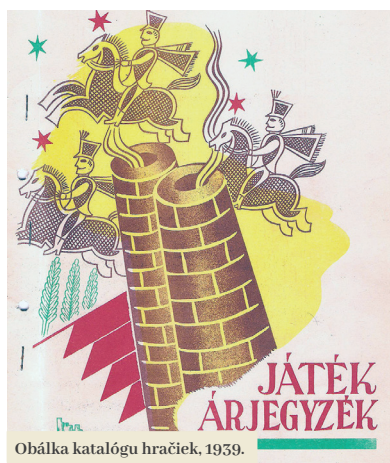
Obálka katalógu hračiek, 1939.

Filakovské hračky sa dajú ľahko odlišiť od ostatných dobových výrobkov, nakoľko boli označené modrou alebo červenou ochrannou značkou kruhového tvaru, s logom MÁVAG-u a nápisom FÜLEK. Továreň bola neskôr premenovaná na Füleki Ipar-