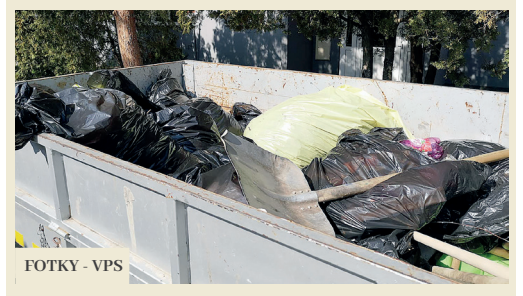
FOTKY - VPS