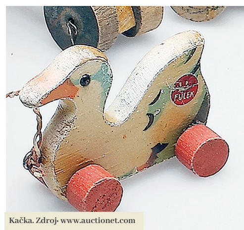
Kačka.