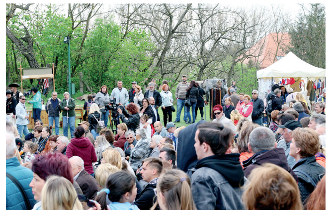
Hlavným organizátorom podujatia bolo MsKS vo Filakove, spoluorganizátormi boli HMF a VPS Filakovo. Tohtoročná Palóčka Veľká noc sa uskutočnila so spoluprácou deviatich partnerov. Podujatie bolo realizované s finančnou podporou Fondu na podporu kultúry národnostných menšín. TEXT - kp