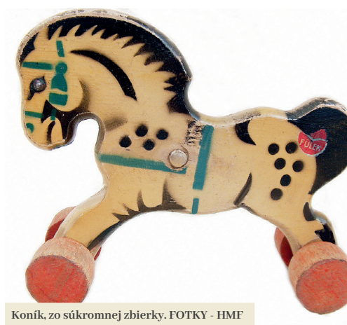
Koník, zo súkromnej zbierky.