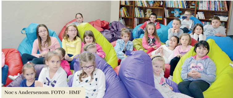
Noc s Andersenom.

V Mestskej knižnici vo Fiľakove oslávili „Marec - mesiac knihy“ viacerými podujatiami.