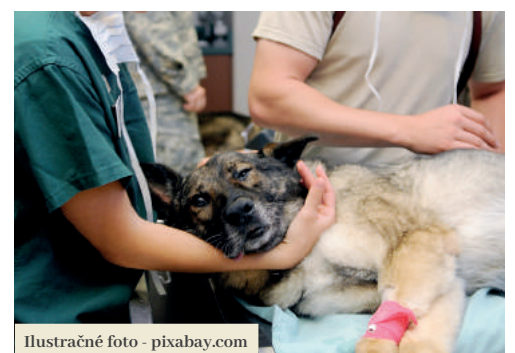
Ilustračné foto - pixabay.com