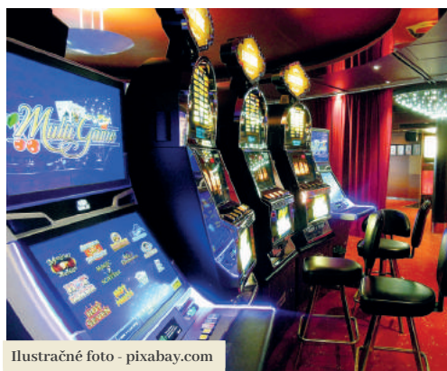
Ilustračné foto - pixabay.com

Ako ďalej povedal, mesto chápe očakávanie časti obyvateľov, ktorí by uvítali celkový zákaz hazardu v meste. Podľa primátora by to však želaný efekt nemalo. „Pokiaľ by sa hazard zakázal celoplošne v celej