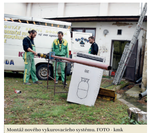
Montáž nového vykurovacieho systému.