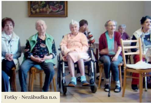
Fotky - Nezábudka n.o.