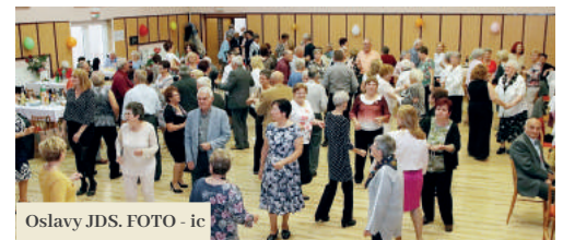
Oslavy JDS.

Vedenie mesta a Zbor pre občianske záležitosti pri MsÚ sa oslavám jubilujúcich občanov venuje už pár desaťročí. Tradične v októbri pozýva do priestorov mestského úradu tých občanov, ktorí v danom roku dovŕšili, resp. do decembra dovŕšia 75., 80. alebo 85. narodeniny, aby im osobne zaoblahoželalo vedenie mesta. Aj tento rok odišlo do domácností viac ako 130 pozvánok a vo štvrtok 24. októbra sa na dvoch stretnutiach oslávencov zúčastnilo takmer 80 jubilantov. Milým malým kultúrnym programom ich pozdravili škôlkari a žiaci ZUŠ. Primátor jubilantom poďakoval za ich celoživotnú prácu v prospech nás a poprial veľa zdravia a spokojnosti v kruhu svojich blízkych. Od členiek ZPOZu si prevzali darčkové balíčky a zapísali sa do pamätnej knihy mesta. Jubilantom, ktorí sa zo zdravotných dôvodov slávnosti nevedeli zúčastniť, mohli, a ešte počas novembra môžu, darček prevziať ich príbuzní.