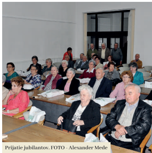
Príjatie jubilantov.