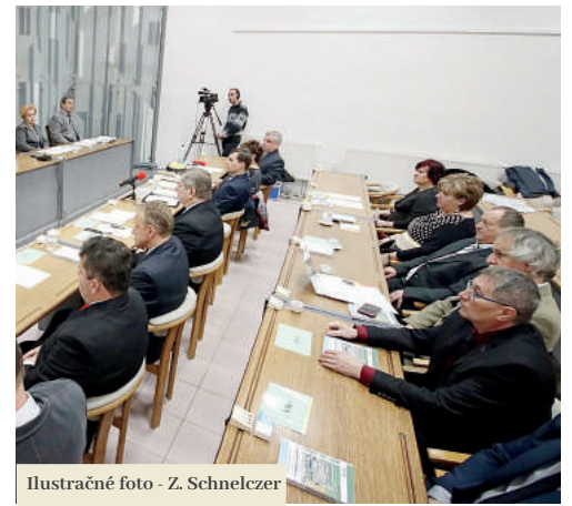
Ilustračné foto - Z. Schnelczer

Program pokračoval prezentáciou zástupcov firmy Ardis, ktorí predstavili svoj návrh jednoduchej pozemkovej úpravy. Pozemková úprava bola nevyhnutná k budúcej realizácii projektu individuálnej bytovej výstavby v lokalite vedľa štadióna FTC. Poslanci návrh pozemkovej úpravy jednohlasne schválili. Prednostka poslancom ďalej predložila návrh na zmenu zásad hospodárenia s majetkom mesta. Poslanci bod schválili s účinnosťou od januára 2020. Rokovanie pokračovalo správami predkladanými hlavnou kontrolórkou mesta. V rámci tohto bodu poslanci schválili nové zásady na ochranu oznamovateľov protikorupčnej činnosti, ktoré vyplývajú z nového zákona.