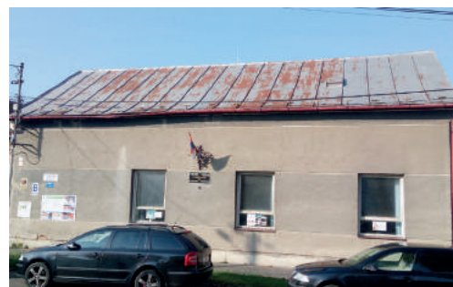
Koncertná sála stratila historický vzhľad.

Samospráva sa rozhodla, že v obnove budú pokračovať a navrátiť budove svoj historický ráz. Podľa predbežných plánov do nej zainvestuje približne 65-tisíc eur. Z nich 12-tisíc chce získať prostredníctvom výzvy miestnej akčnej skupiny LEADER, do ktorej sa zapojí v priebehu nasledujúcich týždňov. „Z dotácie chceme zatepliť zvyšnú časť fasády izoláciou z minerálnej vlny a vrátime na ňu aj historické šambrány a dekoračné prvky medzi oknami. Použijeme historické omietky. Vybudujeme tiež drevené vstupné dvere z Koháryho námestia a vymeníme dvere zo strany tržnice,“ vymenoval. Z vlastných prostriedkov samospráva zrealizuje podreznutie stien, položí nové odizolované podlahy, obnovia vnútorné omietky aj s maľovkami, upraví elektro-