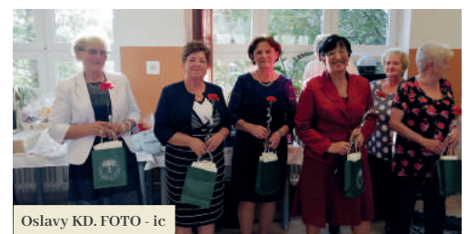
Oslavy KD.