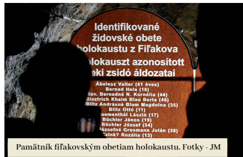
Pamätník filakovským obetiam holokaustu.