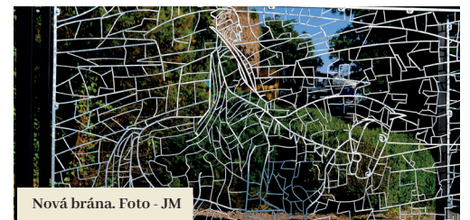
Nová brána.