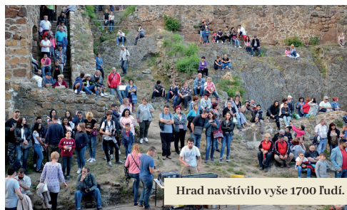
Hrad navštívilo vyše 1700 ľudí.

Program pokračoval pod dominantou mesta odovzdaním umeleckej vstupnej brány do hradu. Najočakávanejšou atrakciou tohto ročníka bolo otvorenie podzemných protiletceckých úkrytov pod hradným vrchom. V nich verejnosti predstavili novú stálu expozíciu s názvom „Filakovo 1938 – 1945“, ktorá dokumentuje udalosti v meste počas II. svetovej vojny (viac sa o výstave dočítate na str. 4., pozn. red.). Po otvorení krytov sa na piatom