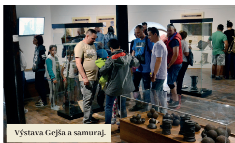
Výstava Gejša a samuraj.