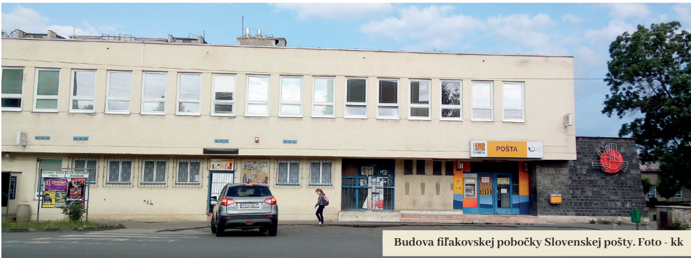
Budova fiľakovskej pobočky Slovenskej pošty.

Budova fiľakovskej pošty sa po približne päťdesiatich rokoch dočká obnovy. Rozsiahla rekonštrukcia, v rámci ktorej plánuje Slovenská pošta vybudovať v doterajších zastaralých priestoroch modernú poštovú halu, by mala skončiť do pol roka. Dovtedy budú klienti pošty obsluhovaní na poschodí budovy.