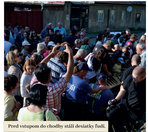
Pred vstupom do chodby stáli desiatky ľudí.

Výsledkom je pútavá a emotívna stála expozícia, ktorú zriadili v dlhšej z chodieb. Podobnú výstavu by ste na širokom okolí hľadali márne. „Je unikátna či už priestormi, v ktorých je zriadená alebo tematikou, keďže sa venuje vyslovene oblasti Filakova.“ Obdobie vojny návštevníkom približuje cez 19 náučných panelov a mnohých predmetov, ktoré boli vo Filakove a na blízkom okolí používané počas vojny. „Sú