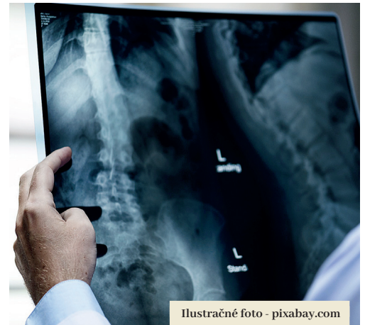
Ilustračné foto - pixabay.com

Podľa slov prednostky má pre Fiľakovo tento