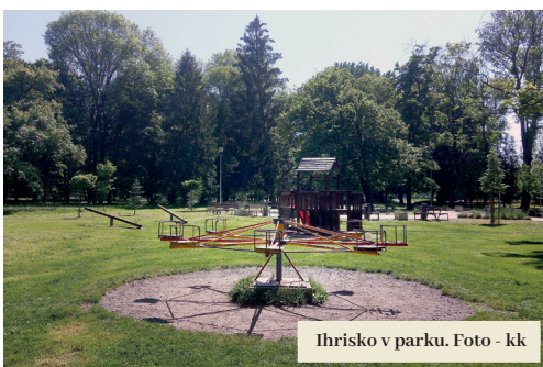
Ihrisko v parku.