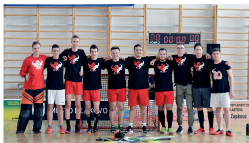
Hráči organizátorského tímu FLK BULLS.