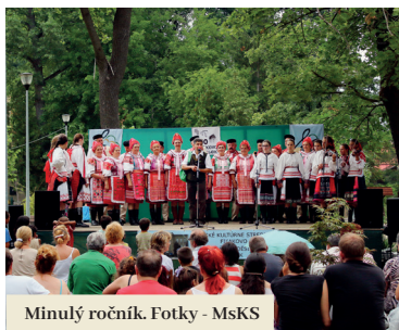
Minulý ročník.