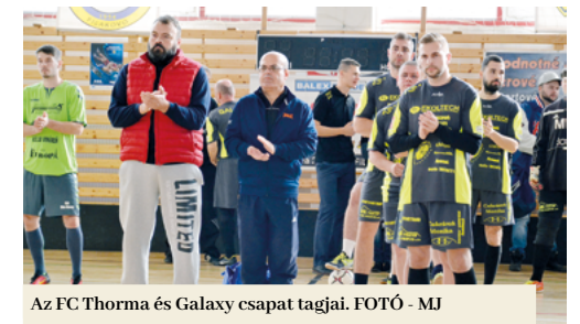
Az FC Thorma és Galaxy csapat tagjai.