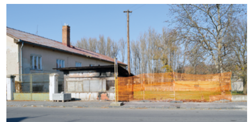
A leglátványosabb átalakuláson a Losonci úton lévő megálló megy majd át. A város körülbelül 17 ezer euró értékben újította fel a négy buszmegállót. A felújításokat a KSz (VPS) munkásai végezték.