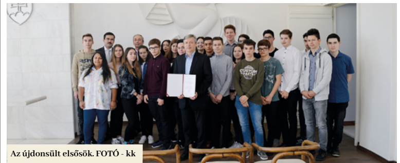
Az újdonsült elsősök.

November 16-án a városi hivatal dísztermében immár harmadszor vehették át egy megújult tradíció keretében a Füleki Gimnázium első éves tanulói a város kiváltságlevelét. Az okirat értelmében tanulmányaik alatt mind a füleki illetőségű, mind a járás vagy kerület egyéb községeiből és városából érkezett diákok Fülek