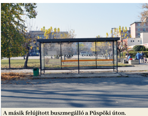
A másik felújított buszmegálló a Püspöki úton.