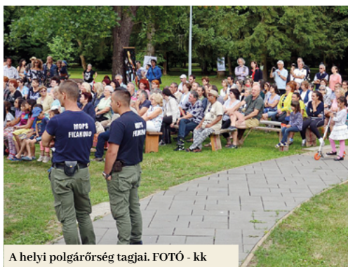
A helyi polgárőrség tagjai.