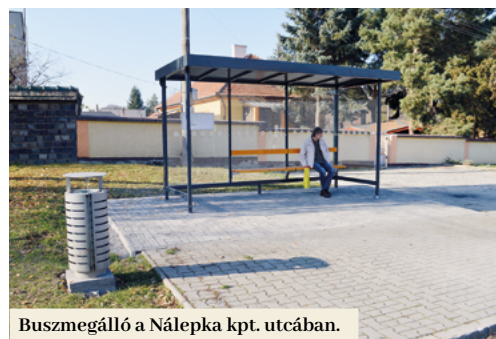
Buszmegálló a Nálepka kpt. utcában.