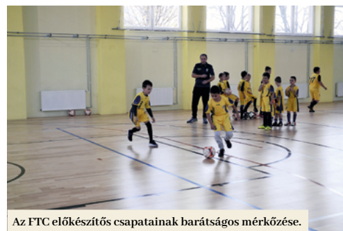
Az FTC előkészítő csapatainak barátságos mérkőzése.

byt városi cég segítségével megvalósult a központi fűtés, a vezetékek és a radiátorok cseréje. Ugyanakkor bekötöttek egy további kazánt is.