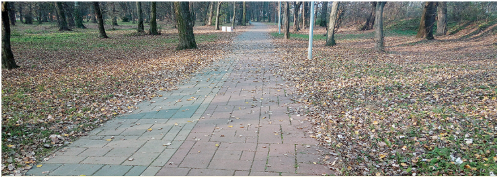
A új kerékpárút két szakaszban kötődne a már létező kerékpárúthoz, amely a városi parkon halad át.

Fülek önkormányzata új kerékpárút építését tervezi, mely a vasútállomást kötné össze az ipari zónával. Erre a célra a város 175 ezer euró összegű regionális támogatást kér a fejlesztési akciótervből.