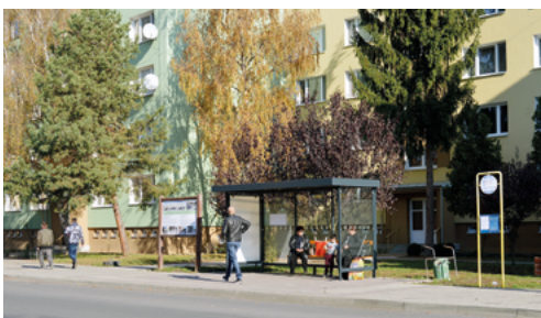
Az önkormányzat négy új buszmegállóba fektetett be, melyekből kettő a Püspöki úton van.