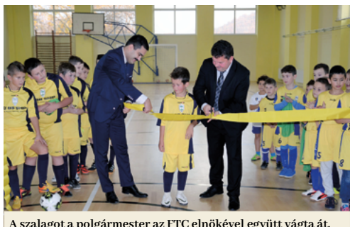
A szalagot a polgármester az FTC elnökével együtt vágta át.

Az FTC tornaterme körülbelül 50 éves múltat tekint vissza, és ez idő alatt nem élt meg lényegesebb felújítást. Ennek dacára rendszeresen szolgál a labdarúgók edzéseinek színhelyéül, és a helyi gimnázium tanulói is használják, mivel nincs saját tornatermük. A városnak kapóra jött a Szlovák Labdarúgó-szövetség pályázati felhívása, amely végül is 25 ezer euró összegű támogatást eredményezett. További mintegy 70 ezer euróval az önkormányzat járult hozzá a felújításhoz. A tornatermet leszígeztették, a patak felé védőgátat emeltek, lecserélték a tetőfedőanyagot, villámhárítót szereltek fel, kicserélték az összes ablakot és ajtókat, újrafestettek mindent, és új izületkímélő sportpadlót raktak le. A Fil-