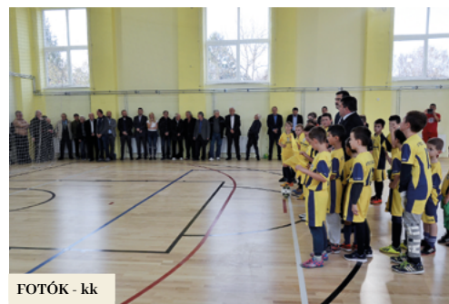
FOTÓK - kk