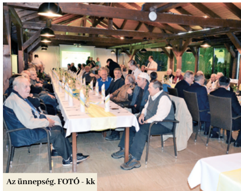
Az ünnepség.

kiléptek a klubból. Miután a várost a Horthy-féle Magyarországhoz csatolták, a csapat a magyar nemzeti bajnokság harmadik osztályában játszott.