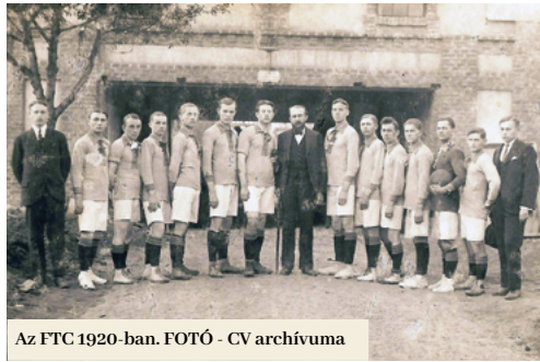
Az FTC 1920-ban.

Cirbus szerint a füleki labdarúgás a 30-as években érte el aranykorát. „Már az 1933–34-es években járási versenyt nyertek a fülekiek és továbbjutottak a divízióba. Azon belül országos bajnokok lettek.” 1937-ben az FTC ismét megismételte sikerét. „Abban az időben budapesti, szenci, prágai labdarúgók, valamint a Slovan játékosai játszottak itt. Egy olyan korszak volt ez, amely azóta sem ismétlődött meg a város történetében”. A II. világháború közeledtével a játékosok fokozatosan