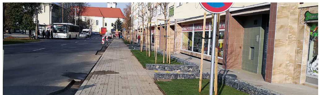
A Püspöki úton lévő bérház előtti terület pár hónap alatt teljesen megváltozott. Az új, kétszintes, vízelvezetéses járdán kívül a város gondoskodott a zöld területek megújításáról, illetve köztéri berendezések elhelyezéséről is. A felújításokat a KSz (VPS) munkásai végezték.

Szöveg és fotó - Kovácsóvá Klaudia, ford. - kp