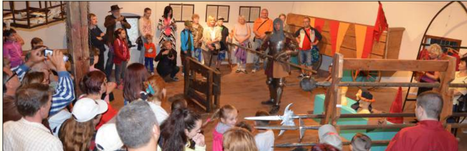
Interaktívna prednáška k výstave Expedícia stredovok na Noci múzei vo Filakove