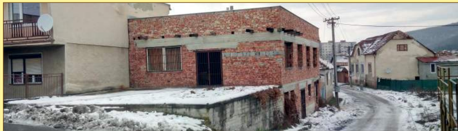
Spomínaná budova na rohu ulice Jilemnického a Lučeneckej cesty

Sajkóm za ŠK Powerlighting Filakovo, doručili mestu v septembri žiadosť o zapojenie sa do výzvy MV SR na rekonštrukciu a výstavbu komunitných centier. Na zriadenie nového KC podľa nich do úvahy pripadali štyri nehnuteľnosti v meste - hrubá stavba na rohu Jilemnického a Hlavnej ulice, rodinný dom na Radničnej