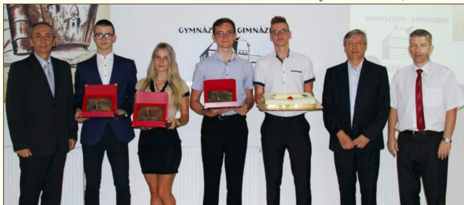
Cena Talentum sa udeľuje v troch kategóriách

V novembri k nám prišli gymnazisti od Dunajskej Stredy až po Veľké Kapušany, aby si zmerali svoje vedomosti. Pozvali sme ich na triatlon, nie však na športový, ale vedecký z oblasti matematiky, fyziky a informatiky. V tomto roku sme usporiadali túto súťaž za finančnej podpory Spoločnosti Pro Futuro, mesta Filakovo a Nadácie Bethlen Gábor. V organizovaní súťaže pomáhajú všetci učitelia matematiky, fyziky a informatiky z našej školy. Počas dvojdňovej súťaže trojčlenné družstvá musia riešiť úlohy z fyzikálneho merania a majú pripraviť fyzikálnu simuláciu. Víťazom súťaže sa stalo družstvo dunajskostredského súkromného gymnázia. Žiaci nášho gymnázia obstáli