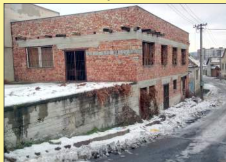
Az említett épület a Jilemnický utca és a Losonci út kereszteződésében

A képviselők a hosszantartó vitát követően végzetül jóváhagyták a KK átköltöztetésének tervét és a Jilemnický utcában található kétszintes ház e célra történő megvásárlását 9000 euróért. Az döntött, hogy közel található a marginalizált közösség által lakott területhez, és elfogadható az ára is. „A döntésnél fontos volt a vételár, mert