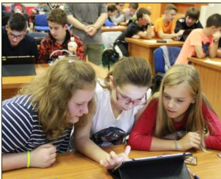
Algoritmánia – 2017

A tanév utolsó tanítási napja mindig ünnepélyes keretek között zajlik a Füleki Gimnáziumban. A bizonyítványosztást díjkiosztó ünnepség előzi meg, ahol az iskola legkimagaslóbb teljesítményt nyújtó diákjai részesülnek elismerésben. A Talentum Díjat a füleki székhelyű e-Talentum nonprofit szervezet és a Füleki Gimnázium adományozza, a Pro Futuro Polgári Társu-