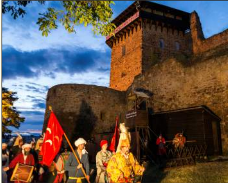
XVIII. Füleki Várjátékok

Kedves Olvasók és Látogatók! Ez alkalommal is ajánljuk figyelmükbe a Füleki Vármúzeum 2017-es tevékenységeit ismertető összefoglalót a Füleki Hírlap decemberi számában. A márciusban induló turisztaszegont, az intézmény megalakulásának 10. évfordulója alkalmából bővített és korszerűsített állandó kiállítással nyitottuk meg, a Nagytapolcsányi Múzeumtól kölcsönzött, „A komlólól a sörig” című idősza-