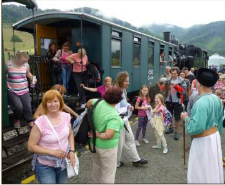
Zbojnícka inventúra – čo za pocesných to sem vláčik priviezol

Prvá júlová nedeľa priniesla nám – štyridsiatim piatim účastníkom výletu MsO JDS vo Fiľakove nevsedné zážitky. Po vyše hodinovej ceste autobusom do mestečka Tisovec nás na tamojšej železničnej stanici už z diaľky vítali kúdole dymu a pary. Jedinečná zubačka, alebo ak chcete, ozubnicová železnica na trati Tisovec – Zbojská – Pohronská Polhora má asi 120 ročnú históriu, nesmierne bohatú na udalosti hlavne v povojno-