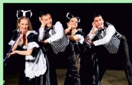
Záber z operetného galaprogramu