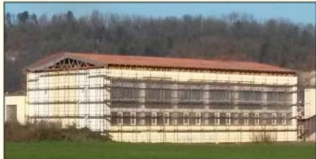
Telocvična na Farskej lúke novou sedlovou strechou a obnovenou parketovou podlahou

V predchádzajúcom roku sme vypracovali a podali projekty na rozšírenie kapacity oboch našich materských škôl. Projekt Materskej školy v Daxnerovej ulici získal v príslušnom dotačnom programe ministerstva školstva dotáciu 58.000 eur, z ktorej bude počas letných prázdnin v roku 2016 zabudovaná terasa na čelnej strane budovy škôlky a vytvorí sa tak možnosť na umiestnenie ďalších 20 detí v materskej škole od nasledujúceho školského roku. Na výmenu okien časti budovy od Daxnerovej ulice sme vyhradili finančné krytie v rozpočte mesta na rok 2016, na zvýšenie energetickej efektívnosti ďalšej časti budovy sme podali projekt na ministerstvo životného prostredia a bude vyhodnotený v jarých mesiacoch. Financie potrebné na projektovanie komplexnej rekonštrukcie Materskej školy na Štúrovej ulici, po skoro desaťročie trvajúcom nečinnom vyčkávaní, odsúhlasilo mestské zastupiteľstvo tiež v mestskom rozpočte. Na sta-