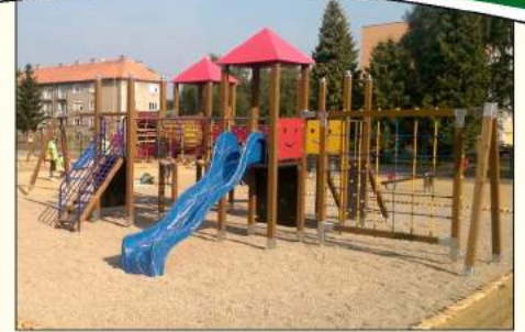
Obnovené detské ihrisko na Mládežníckej ulici

Ako sme to spomenuli aj v predchádzajúcom bode, preradením činnosti z centra voľného času do MsKS (resp. Základnej školy s vyučovacím jazykom slovenským na Farskej lúke) a podchycením súborov a hudobných formácií pôsobiacich v rámci tejto inštitúcie, bola ukončená reforma siete kultúrnych ustanovizní naštartovaná v predchádzajúcich rokoch, ktorá sa snažila zohľadniť požiadavky aj národných/národnostných spoločenstiev mesta v oblasti kultúry. Takto sa dostali pod jednu strechu tradičné maďarské súbory (Pro Kultúra, Melódia, Rakonca, Kis Rakonca, Zsákszinház), slovenské folklórne súbory (FS Jánošík, DFS Jánošík) a v budove bývalého závodného klubu vzniklo aj rómske komunitné centrum. K zjednodušeniu a sprehľadneniu financovania kultúry na úrovni mimovládnych organizácií mala slúžiť novelizácia Všeobecne záväzného nariadenia mesta, ktorým sa určuje metodika poskytovania dotácií z rozpočtu mesta. Na projektovanie komplexnej rekonštrukcie