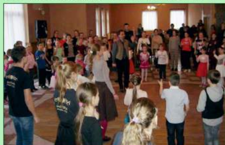
Najúspešnejšie podujatie týždňa: tanečný dom pre deti

V tanečnom dome v rámci Dní maďarskej kultúry, tancovalo viac ako sto detí, programov pre mládež a dospelých sa zúčastnilo trikrát toľko návštevníkov. Hlavným organizátorom týždňa trvajúcej série programov SPOZNAJME SA! bolo Mestské kultúrne stredisko Fiľakovo, v