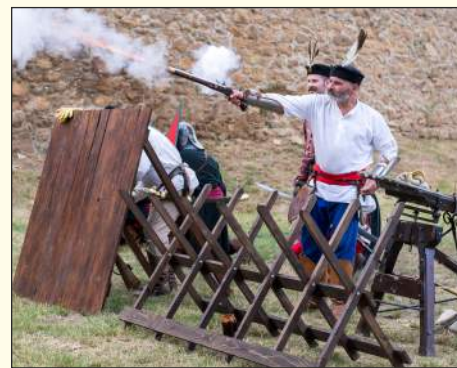
A Füleki Várjátékok csatajelenete