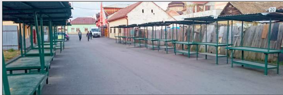
„...a Piac utcából eltűnnek az ízléstelen, fémből készült vásári standok“

„Az a fontos, hogy a Piac utcából eltűnnek az ízléstelen, fémből készült vásári standok, amelyek rontják az összbemódot a városközpontban. A jövőben parkolóhelyek létesülnének a helyükön, amivel tehermentesítenénk a városháza előtti parkolót. Ezek azonban hosszú távú, a következő választási időszakban megvalósítható tervek.“