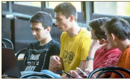
Az Infoprog 2016 versenyen a fülekiek a kódfejtéssel foglalkoznak

zett Infoprog nemzetközi versenyen diákjaink rendszeresen dobogós helyezést érnek el, valamint a kerületi Zenit programozói versenyen és az informatikai olimpiász kerületi fordulóján is sikeresek. Készítettek már androidos alkalmazást a Medvesi Fotós Maratonhoz, játékokat alkottak meg alapiskolás tanulók számára, valamint az oktatásban használt programot is írtak. Diákjaink munkája a Neumann János Nemzetközi Tehetségkutató Programtermék Versenyen 2. díjat kapott. Dobogós helyezést értek el diákjaink a matematika olimpiáson, a Felvidéki Magyar Matematikaversenyen. A nyolc éves tagozat diákjai a Junior Náboj matematikaversenyen járási fordulójában 1. helyezést értek el, a Zrínyi Ilona Matematikaversenyen az első és második helyen végeztek.