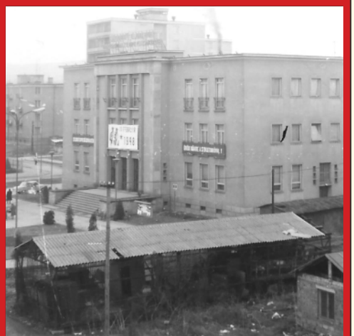
Az Üzemi Klub épülete az 1960-as évek végén